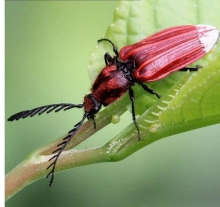
Le Taupin à 2 taches ( Calambus bipustulatus )