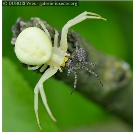
Les Araignées crabe Misumena