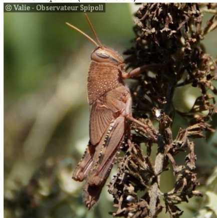
Les Sauterelles ( Tettigonoidea )