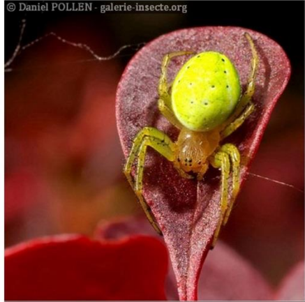
Les Epeires concombre ( Araniella )