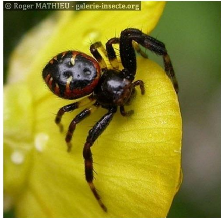
L'Araignée crabe Napoléon ( Synema globosum )