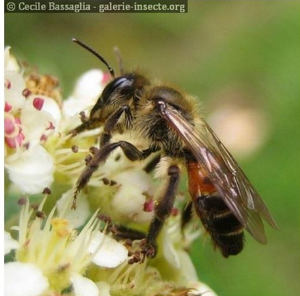
Les Bourdons à pilosité fauve ( Bombus )