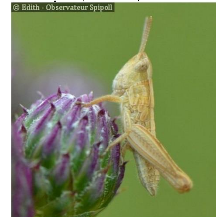
Les Sauterelles ( Tettigonoidea )