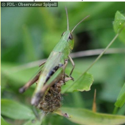
Les Criquets ( Acrididae )