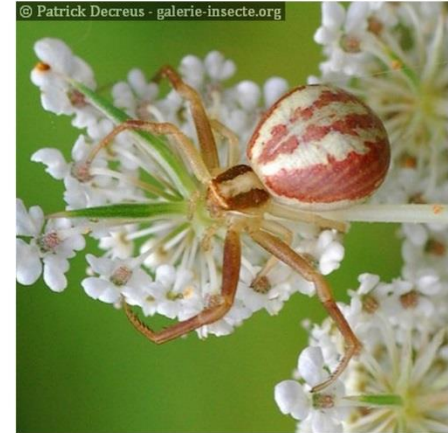
L'Araignée crabe Runcinia ( Runcinia grammica )