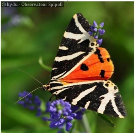
Le Sphinx Bourdon ( Hemaris tityus )