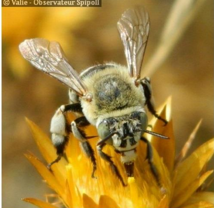
La Collète du Lierre ( Colletes hederæ )