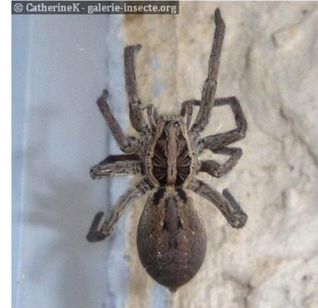
Les Araignées loup ( Lycosidae )