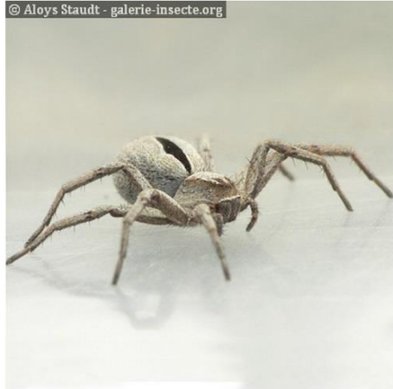
Les Araignées crabe Thanatus