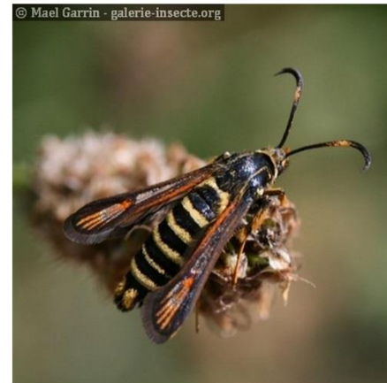
Les Syntomies ( Amata )