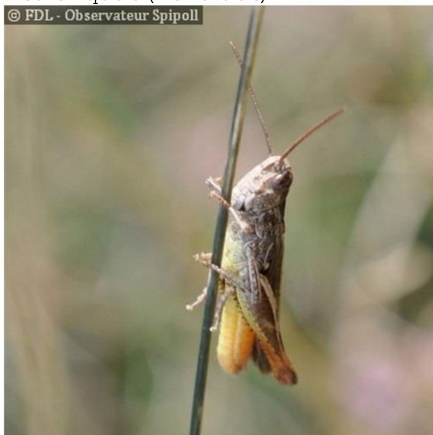
Les Sauterelles ( Tettigonoidea )