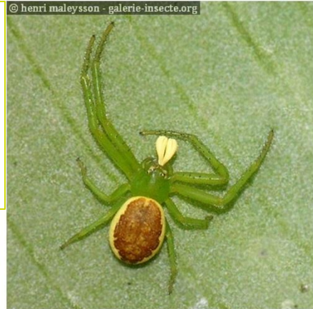
Les Araignées crabes Diaea