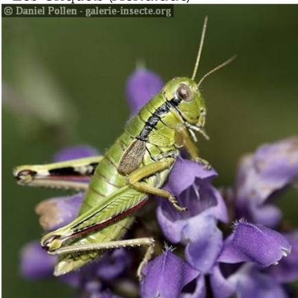
Les Sauterelles ( Tettigonoidea )