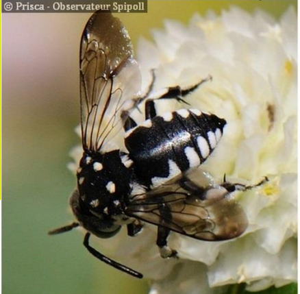
Les Anthidies ( Anthidium et autres)